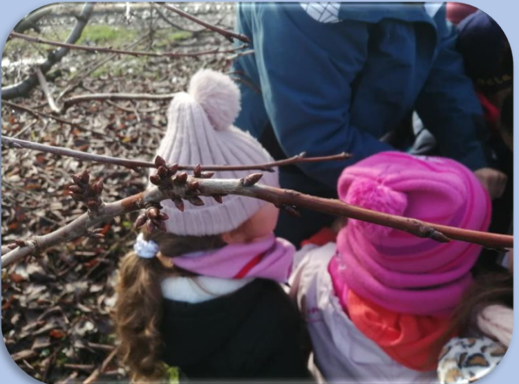
We tried to look inside a bud: the leaf and flower are very small, but they are growing