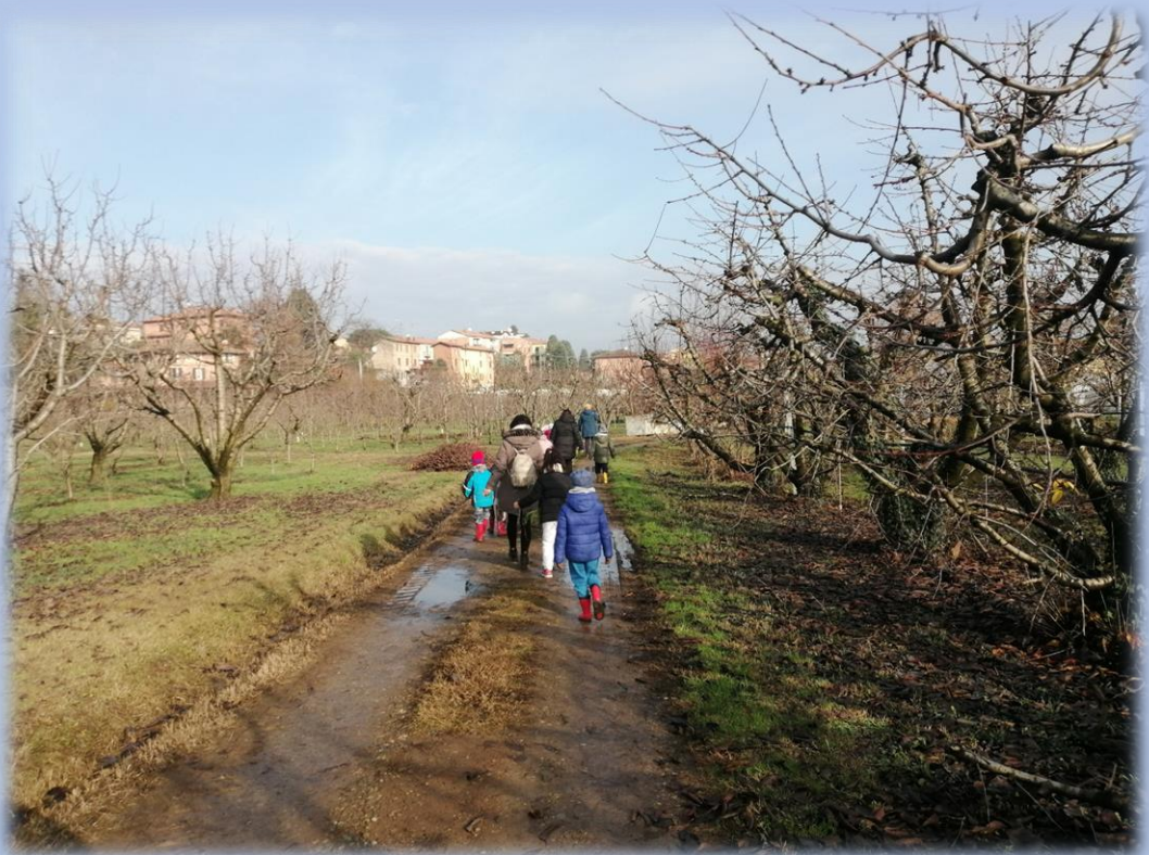
Walking through a cherry field